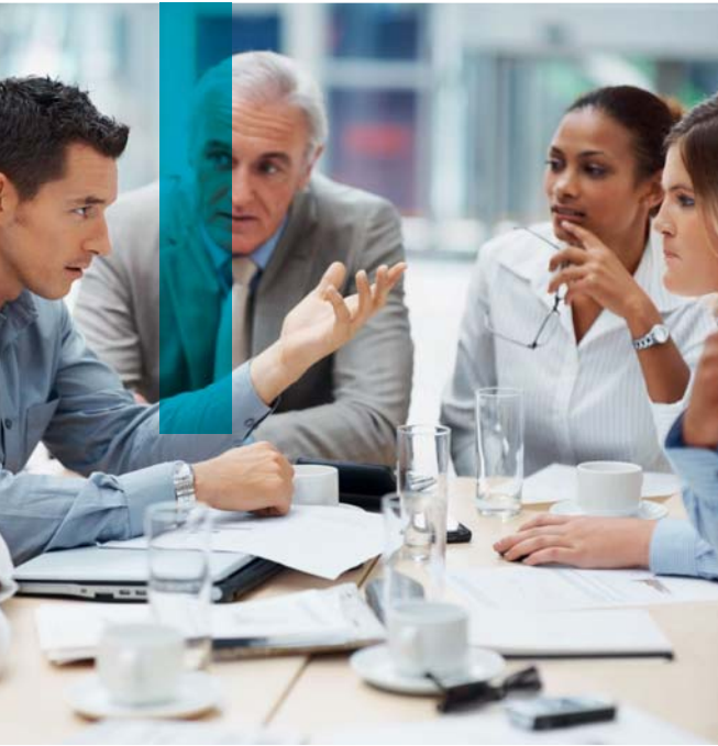
CRIQ, 2013/12/06 - © Tous droits réservés

Pour obtenir des conseils ou de l'information concernant le service d'identification d'opportunités technologiques d'affaires: